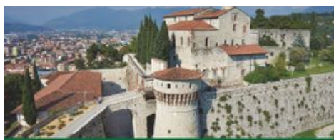
APPUNTAMENTI NAZIONALI DI ICOM ITALIA BRESCIA, 4-6 APRILE 2025