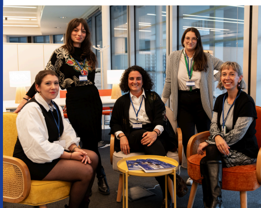
BUON 2025 DALLA SEGRETERIA DI ICOM ITALIA!

Sempre con grande piacere colgo l'occasione della prima newsletter dell'anno per formulare a tutti voi gli auguri più sentiti per un nuovo anno ricco di gioia e di soddisfazioni.