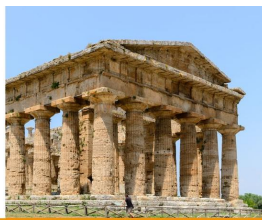
Paestum 21-22 novembre 2020